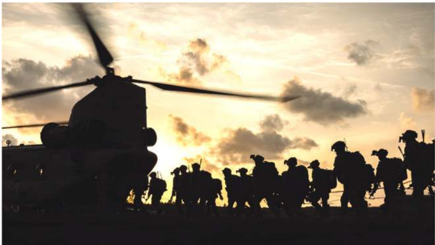
Wonju's stijgen in een CH-47 voor een actie bij duisternis

Door het hele jaar heen was vorming de rode draad. Met het opspelden van de RANGER-tab eind 2023 zijn er tevens hoge verwachtingen geschept van onze WONJU's op het gebied van hun militaire vermogen. Hier hebben we in 2024 hard aan gewerkt om met name onszelf te trainen in de mentale component, groepsvorming en de rol van de junior leader .