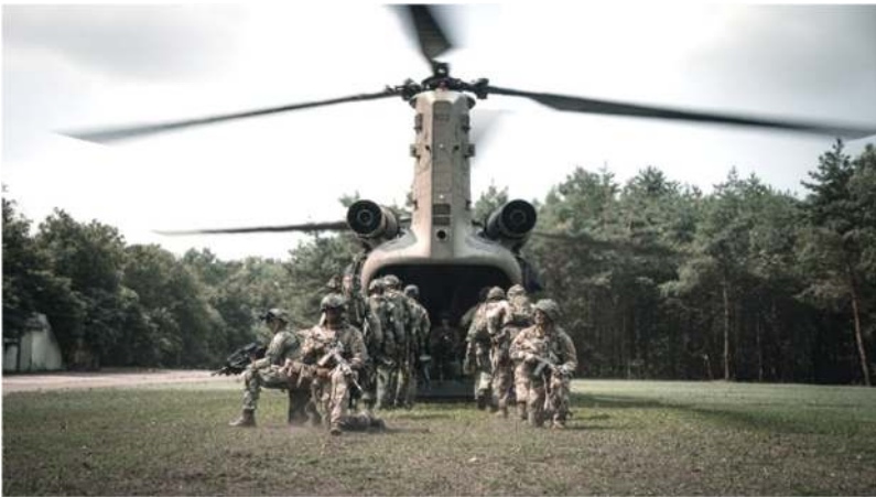
Wonju's stijgen in een CH-47 tijdens de oefening JOINT FALCON

Vlak voor het zomerverlof kreeg de B-WONJU-Compagnie nog de kans om een retentietraining te hebben op de basis en de kern van ons optreden: Air Assault . In samenwerking met het Defensie Helikopter Commando (DHC) werden er meerdere acties gepland en kon er uiteindelijk ook nog een actie uitgevoerd worden tijdens de oefening JOINT FALCON.