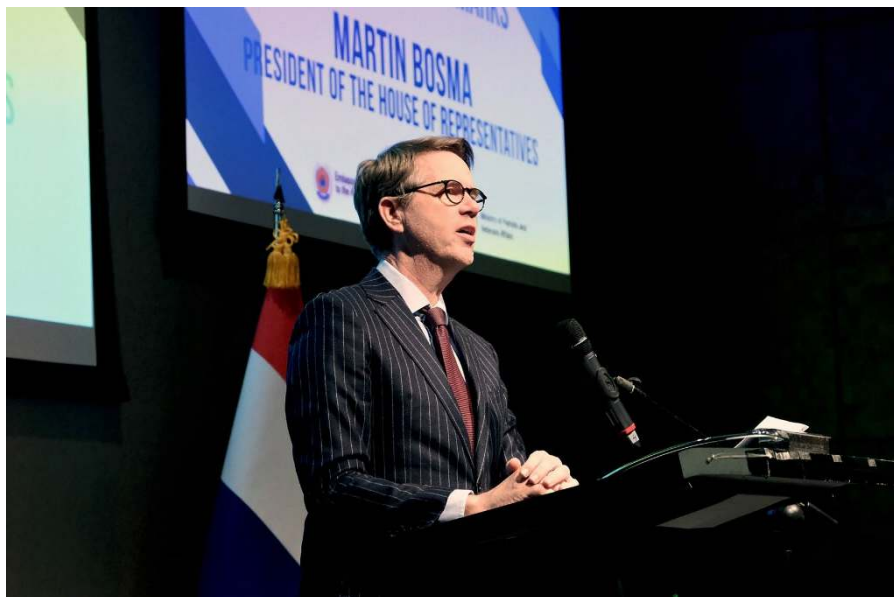
De voorzitter van de Tweede Kamer, Martin Bosma

Hij zei hierover: “Dit is de tweede keer in korte tijd dat een Kamerdelegatie eer betoont aan de Nederlanders die gesneuveld zijn in Korea, en aan de veteranen die zich daar na hun overlijden bij hun vroegere strijdmakkers hebben laten begraven.”