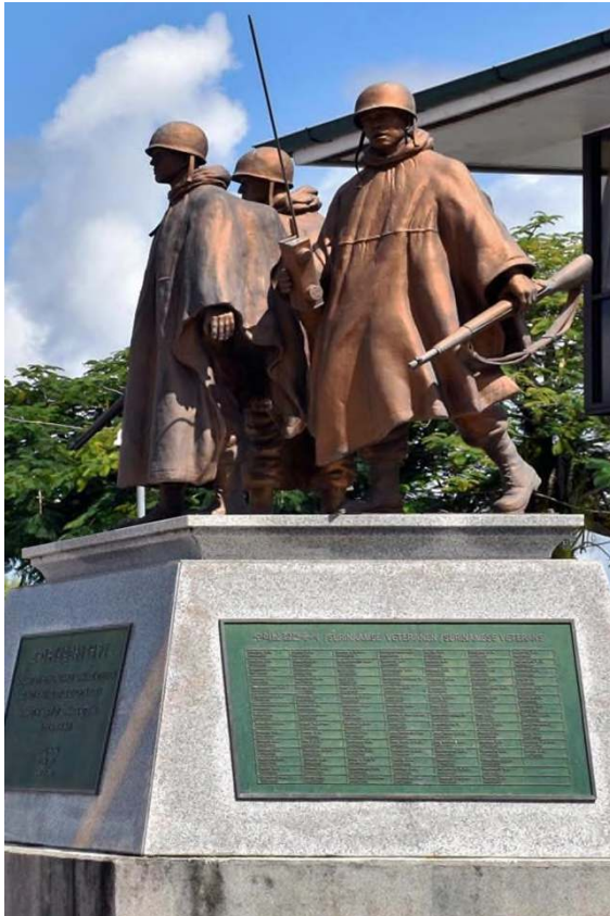
Het Korea-monument in Paramaribo (Suriname)