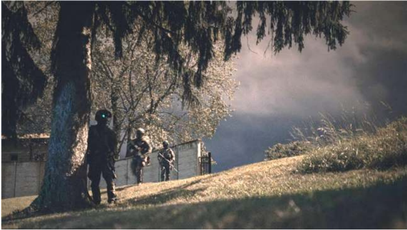
Wonju's bezig met URBAN MOVEMENT tijdens de oefening AMERICAN