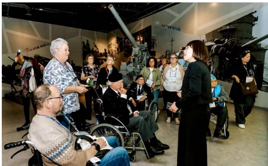
Rondleiding door het War memorial Museum Seoul

In de namiddag hadden we een ruim uur de tijd om te shoppen in Insadong. Deze wijk is een van de meest bekende winkelgebieden van Seoel. Het wordt gedomineerd door vele theehuizen en er zijn Koreaanse restaurants en winkeltjes die allerlei traditionele Koreaanse spulletjes verkopen. We haalden er ons hart op, terwijl we souvenir'tjes voor de thuisblijvers en onszelf kochten.