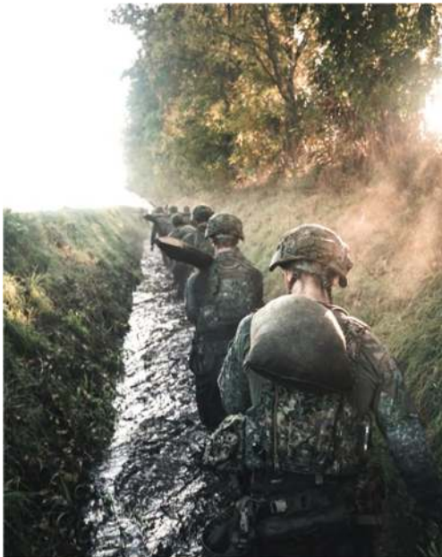
Uitzichtloosheid als een van de vormingsdoelen tijdens de WONJU PATROL

De dreiging tijdens deze oefening nam op sommige momenten toe, waardoor er vaak op-, en afgeschaald moest worden in het geweldsniveau. Een zeer interessante oefening waarbij het vooral goed was om schouder-aan-schouder met onze primaire partners te trainen.