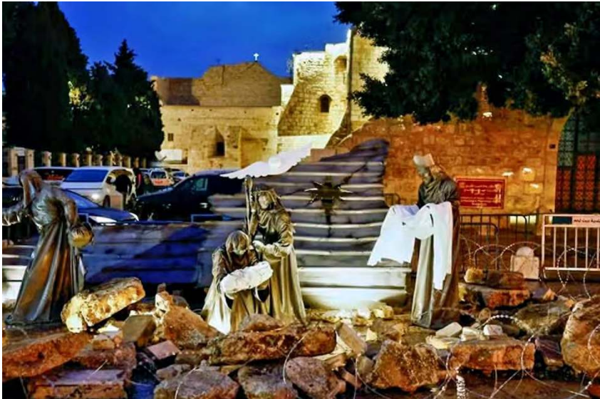
Het Kerstkindje te midden van de brokstukken in Betlehem

tekst bij het logo is uit Zacharia 4:6, 'Niet door kracht of geweld, maar door mijn Geest'. Mijn eerdere schrik, zojuist geschreven, week van mij. God heeft deze profeet laten weten dat hij zelf de wereld zal redden als het einde dreigt. Niets en niemand, maar hij alleen! En hier is het 'begin van het einde' voelbaar, zichtbaar, hoorbaar en met ons verstand berekenbaar, wanneer wij ons laten betrekken bij de geboorte van Jezus in Bethlehem, als kind van God, zoon van Maria en Jozef, herder van herders, en wereldvorst van engelenkoren (hemelse legers), die gezongen hebben van vrede op aarde bij mensen die God eren en elkaar liefhebben.