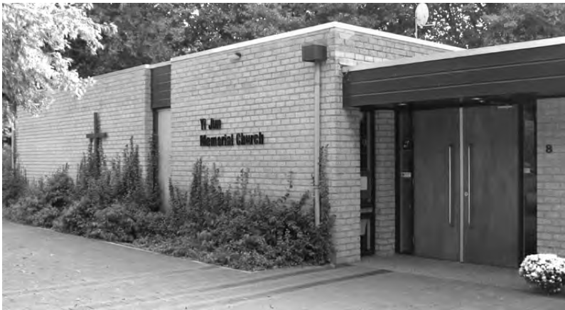
Yi Jun Memorial Church - Leidschendam