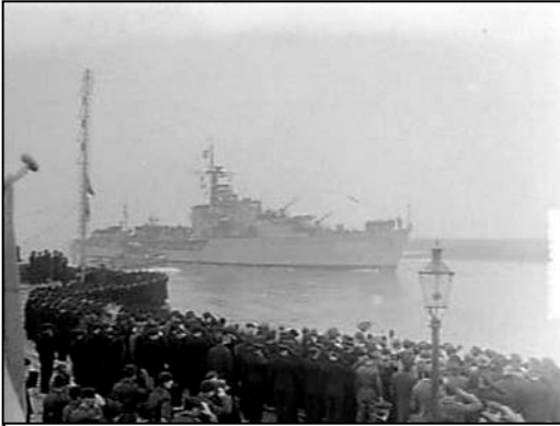
Aankomst in Den Helder

volkslied aan te horen. En geloof het of niet, er viel een kei op dek en toen dacht ik: “gelukkig, ik ben weer thuis”. Dat moment vergeet ik nooit meer, het staat nog helder voor de geest. Dit waren een paar voorbeelden om de marineveteranen aan te sporen nu het nog kan je verhaal op te schrijven en zo een bijdrage te leveren aan de V.O.K.S.-V.O.X. zodat andere veteranen een