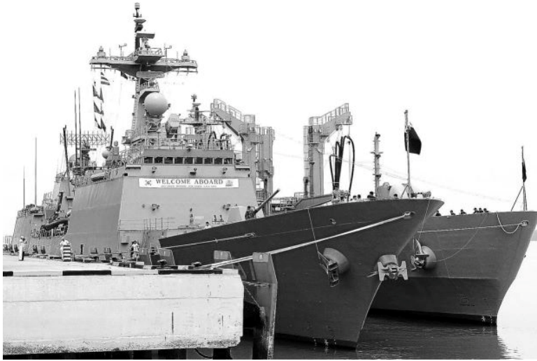
De beide Koreaanse schepen Roks Dae Jo Young en Roks Hwa Cheon