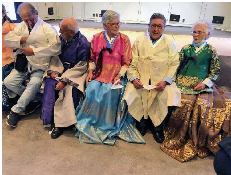
De Hanbok Ceremonie

Deze dag stond in het teken van de presentatie van het Revisit programma, het voorstellen van de begeleiders en de 'Hanbok' ceremonie. Deze ceremonie is vergelijkbaar met de welbekende klederdracht foto's uit Volendam maar dan op z'n Koreaans.