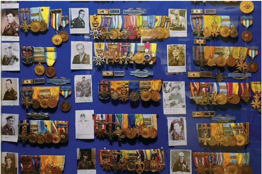
Een deel van de vitrine met medailles in het Korea-museum Schaarsbergen

Militaire onderscheidingen hoeven niet te worden geretourneerd. Enkele voorbeelden daarvan zijn de Militaire Willems-Orde, De Bronzen Leeuw, het Bronzen Kruis, het Kruis van Verdienste, het Vliegerkruis, het Mobilisatie-Oorlogskruis, het Ereteken voor Orde en Vrede, enz. In ons museum in Schaarsbergen zijn inmiddels een groot aantal militaire onderscheidingen van overleden Korea-veteranen in een speciaal daarvoor ingerichte vitrine aangebracht met daarbij een foto van de drager. Indien u wilt dat uw medailles daar worden aangebracht, overleg dit dan met uw familie en laat dit dan tijdig weten aan het secretariaat van de VOKS.