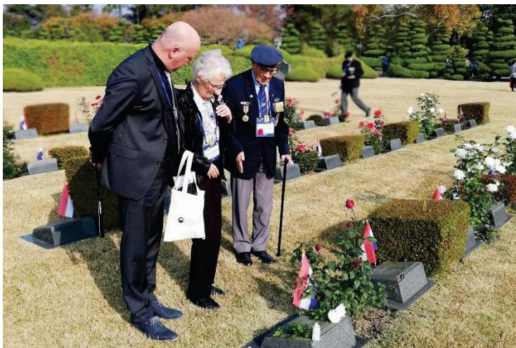
Mevrouw Radstaat voor het eerst bij het graf van haar broer

Vroeg uitchecken, bagage in de vrachtwagen en naar het UNMCK. Deze dag had voor een ieder van ons een persoonlijk tintje. Eerst op zoek naar het veld waar de Nederlandse militairen begraven liggen, vervolgens kijken waar jou dierbare ligt om een bloem of bloemenkrans te leggen en je herinneringen de vrije loop te gunnen.