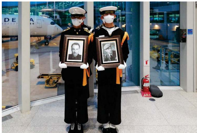
Erewacht bij de uitgang van het vliegtuig in Seoul

Om 15.45 uur (Koreaanse tijd) kwamen we aan op de luchthaven Incheon in Korea en moesten we wachten tot iedereen uit het vliegtuig was. De 'mannen' hebben zich daarna in het vliegtuig omgekleed in DT.