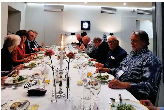
Diner bij Ambassadeur Doornewaard (links in de rode jurk)

Misschien kan iedereen zich voorstellen hoelang het duurt voordat je 114 personen goed hebt opgesteld en de foto hebt gemaakt. Alle bezoeken aan de plaatsen werden daardoor wel behoorlijk ingekort maar het ontvangst was telkens weer heel hartelijk en warm.