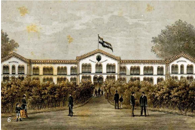
Bronbeek 1881

We nodigen iedereen van harte uit om onze activiteiten te bezoeken.