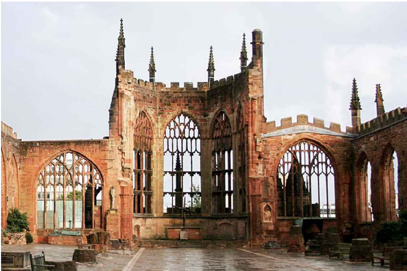
In de oorlog verwoeste Kathedraal van Coventry

Dit gebed is begonnen door de kerkgemeenschappen van Coventry in Engeland en Dresden in Duitsland waar monumentale, eeuwenoude kerken zwaargehavend achterbleven na de oorlogshandelingen. Toen in Coventry onder de puinhopen twee dakspanten in de vorm van een kruis werden gevonden, werd dat opgevat als een oproep tot verzoening.